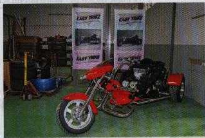
Natürlich wird auch das Prunkstück, der Taifun, hier produziert. Beim Preis-/Leistungsverhältnis dürfte er sowohl für das WK-Strike, als auch für das RF 1 eine denkbare Alternative sein.