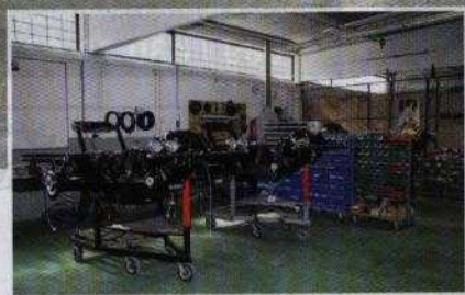
Die geräumige Produktionshalle ist zurzeit mit Bestellungen gut ausgelastet. Vor allem der französische Markt verlangt nach Dreirädern.